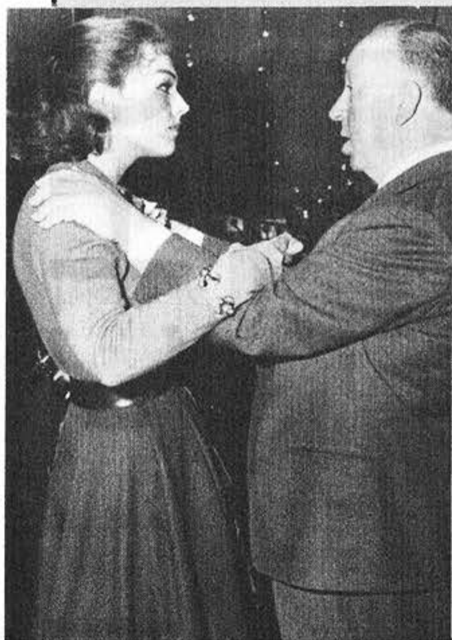
La actriz Kim Novak (Madeleine Elster y Judy Barton) con el director Alfred Hitchcock.

Con ésta, la película número cincuenta en la filmografía de Hitchcock y la vigésimo tercera de su producción norteamericana, el realizador parece haber alcanzado una de las cumbres de su carrera. En más de una encuesta efectuada por los críticos aparece como una de las diez mejores películas de la historia del cine y son innumerables los estudios que se le han dedicado. De algunos de ellos extractamos aquellos conceptos que nos parecen más válidos, con la perspectiva que nos proporciona la distancia de treinta y dos años de la fecha de su realización.