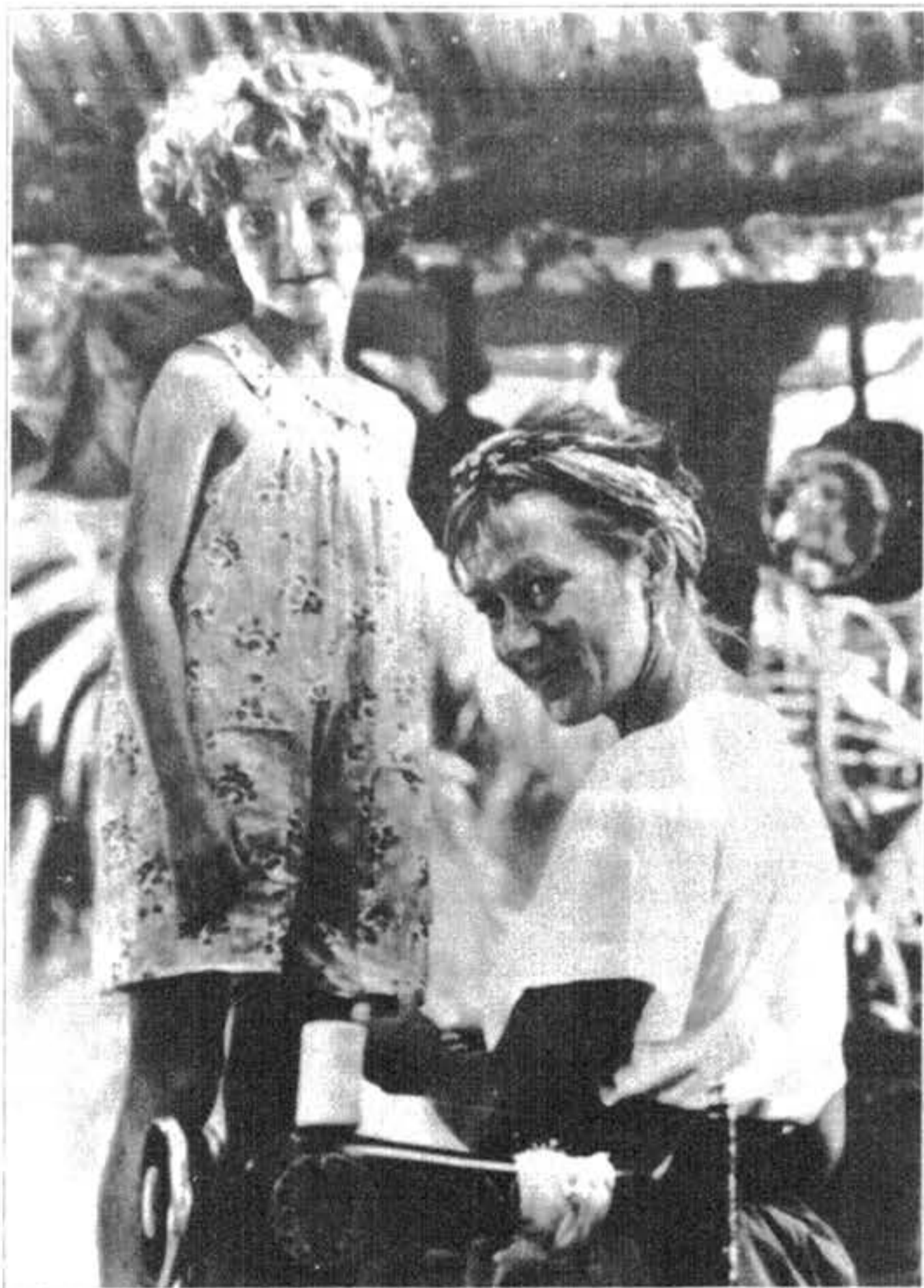
Producción: Grafimar Ltda