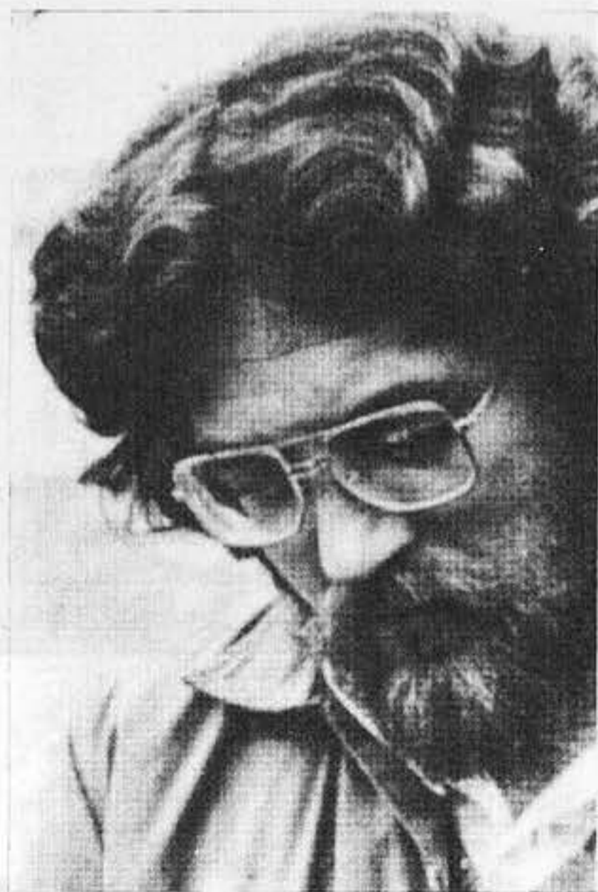
Francisco J. Lombardi

...En todas mis películas está presente esa tendencia po-