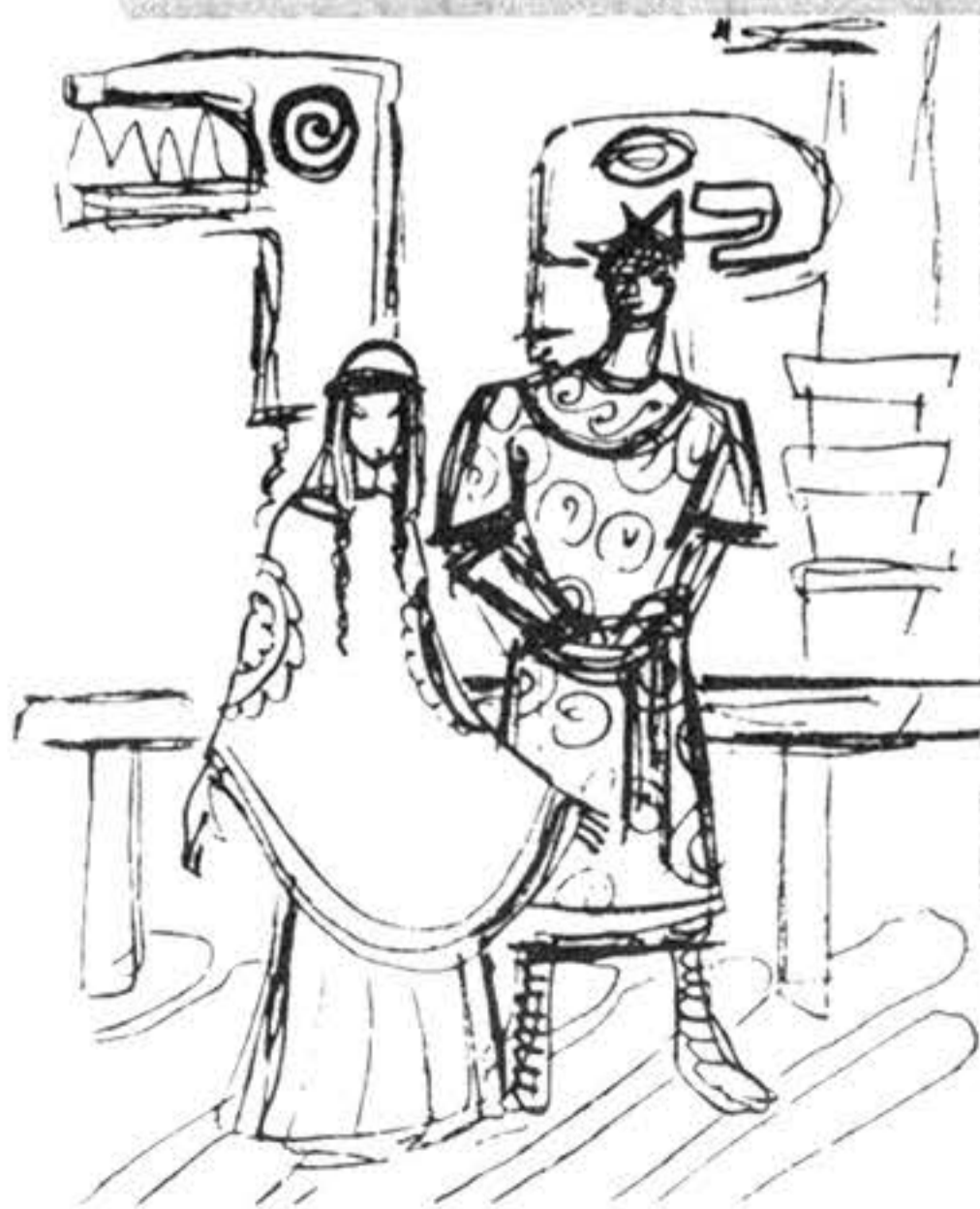
Boceto para Alexander Nevsky

“Sin una visión concreta de las personas y las acciones, los actos, las situaciones recíprocas, no es posible fijar en el papel su modo de proceder. Se mueven incessantemente ante los ojos. A veces, de manera tan palpable que, sin abrir los ojos, parece que podrían ser fijados en el papel.... Aparecen los esbozos. No son una ilustración del guión.... A veces son la anotación concreta de la percepción que deberá surgir de la escena; con la mayor frecuencia, búsquedas. Versión taquigráfica en dibujos: no pretender ir más allá.”