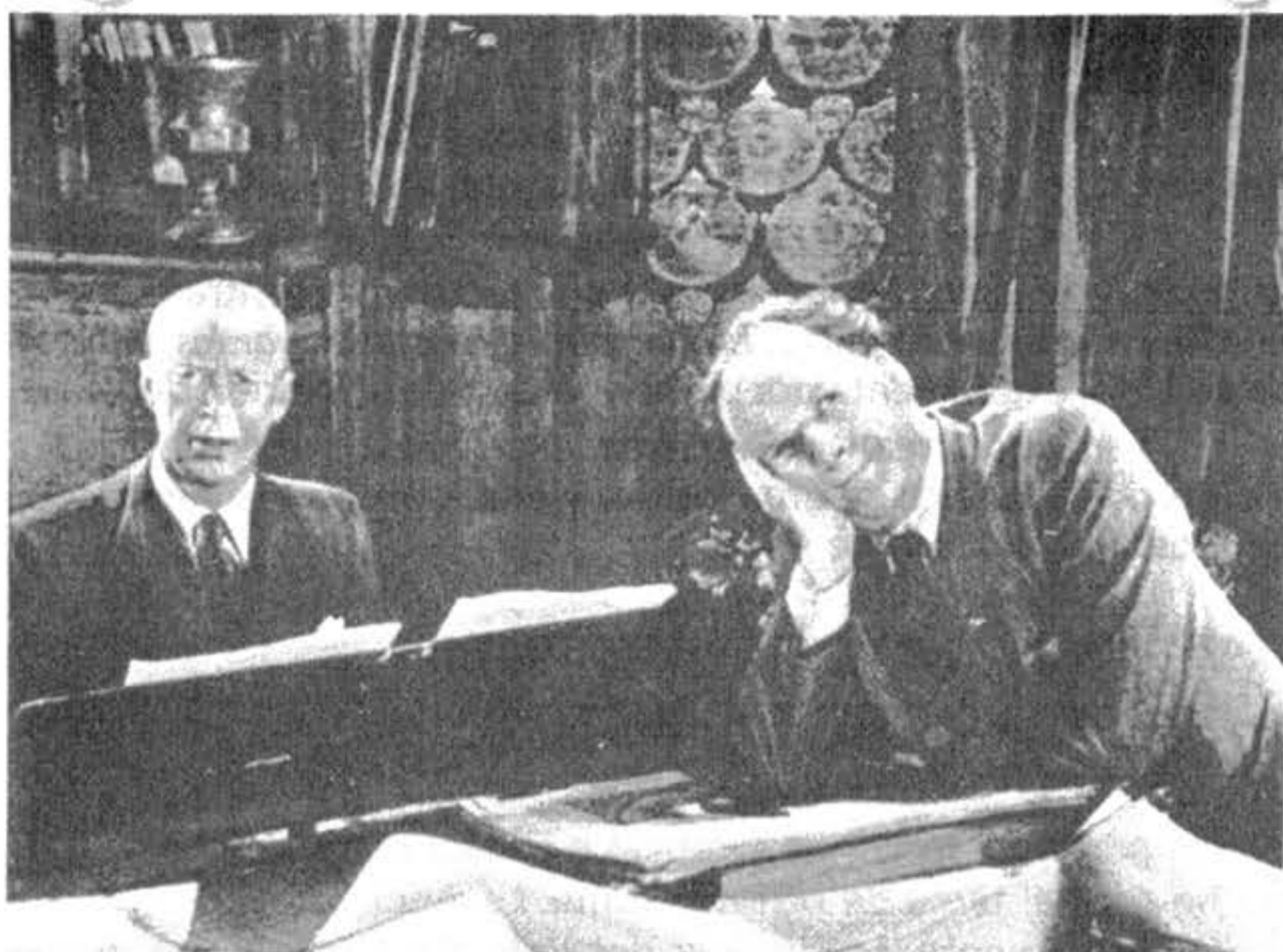
Eisenstein con el compositor Serguei Prokofiev (al piano)